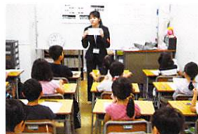
低学年のクラスは先生が丁寧にサポートします。