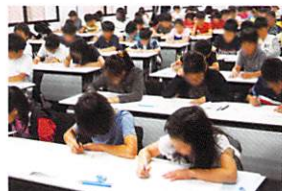
試験開始の合図で一斉に問題に取り掛かります。